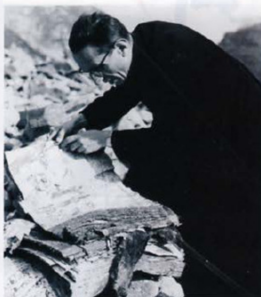
Sacerdote che recupera un libro durante l'alluvione di Firenze del 1966

Perché la Fondazione si è interessata alla sicurezza dei libri antichi, e perché è venuta a Firenze e non a Roma? Il vice presidente Carlo Hruby ha innanzitutto spiegato che i libri antichi racchiudono in se stessi la forma dell’arte e la sostanza della cultura e che, per questo motivo, sono da sempre prede ambite sia dei ladri comuni che dei bibliofili. Una categoria, quest’ultima, che rende ancora più difficile la prevenzione, essendo notoriamente spinta da motivazioni diverse da quelle venali o commerciali.